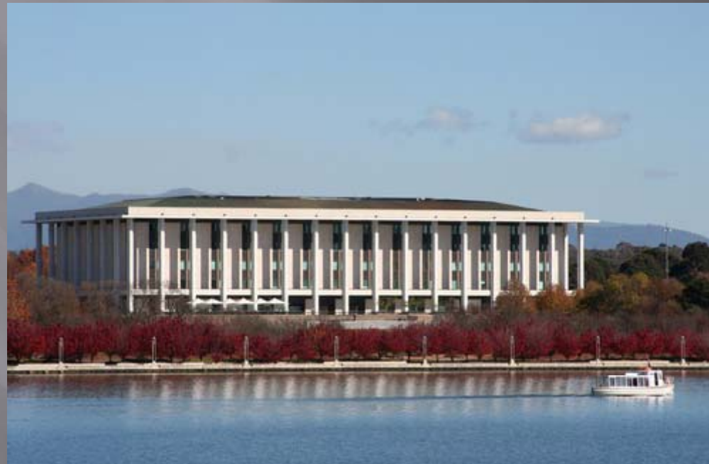
National Library of Australia