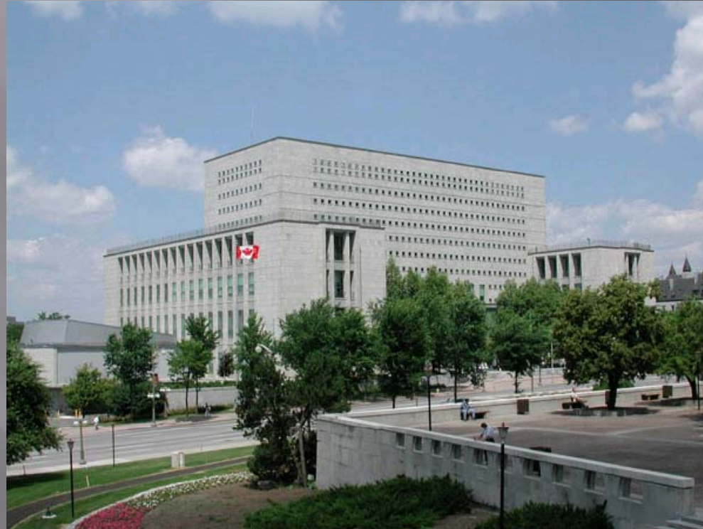
Library and Archives Canada