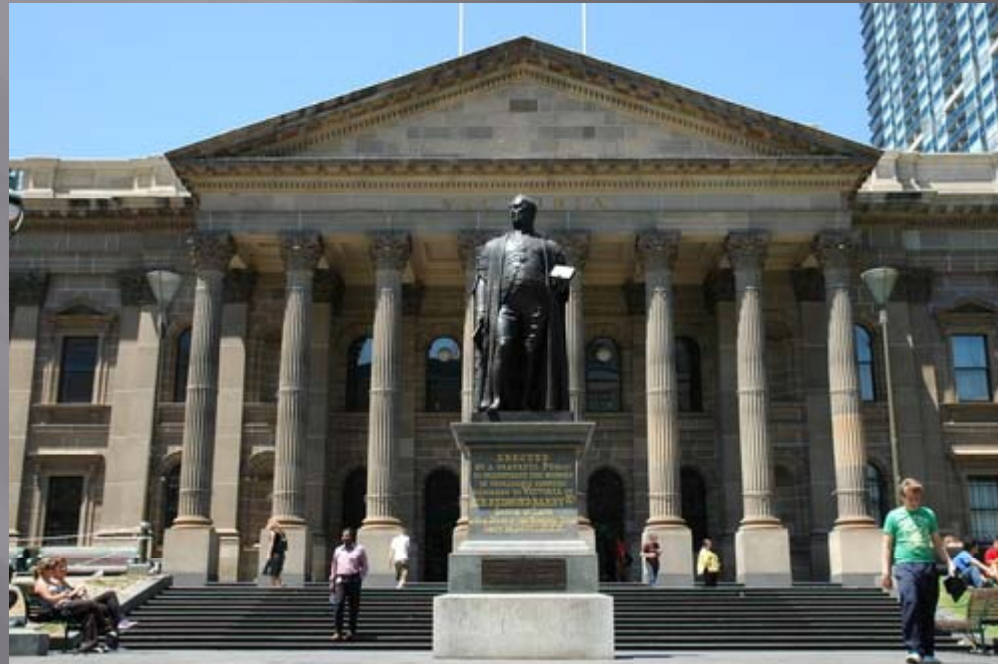
State Library of Victoria