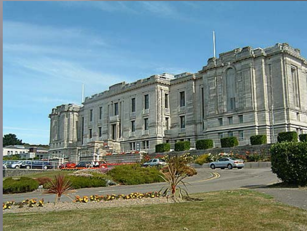
National Library of Wales